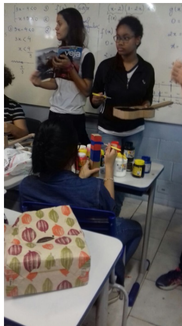
Figura 2: Alunos pintando e decorando seus instrumentos. Na imagem podemos ver o cavaquinho e um chocalho sendo pintados e uma aluna procurando imagens na revista para recortar.

Os grupos que já construíram os três instrumentos, nesse momento, encontram-se fazendo a parte de artes, pois, como dito anteriormente, o trabalho realizado na E.E Djalma Octaviano também é ministrado pela professora de artes da escola. A decoração envolve recortes, colagens e pinturas.