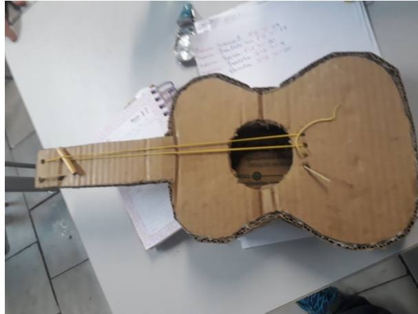
Figura 1: Cavaquinho em elaboração. As cordas de elástico posteriormente foram substituídas por fios de náilon.

Os grupos que já construíram os três instrumentos, nesse momento, encontram-se fazendo a parte de artes, pois, como dito anteriormente, o trabalho realizado na E.E Djalma Octaviano também é ministrado pela professora de artes da escola. A decoração envolve recortes, colagens e pinturas.