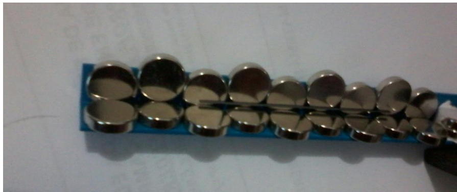
Figura 1. Fotografia da levitação do grafite de lapiseira sobre um trilho magnético.

A foto não é clara, não dá para afirmar somente baseando-se nela. Por isso, um dos objetivos deste experimento é justamente esse: Como exibir a levitação e não gerar dúvidas? Esse é um dos pontos que serão trabalhados até o relatório final.