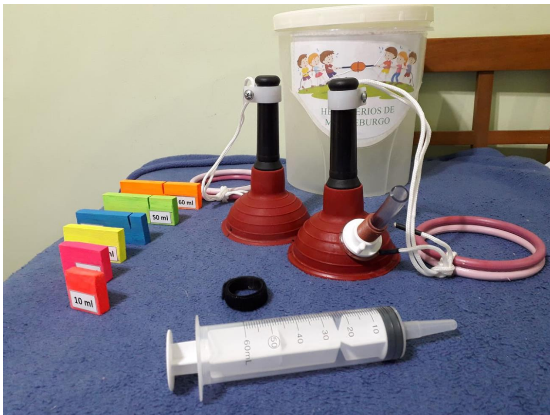
Figura 5: Resultados obtidos dos passos seguintes- Montagem experimental completa do experimento B.