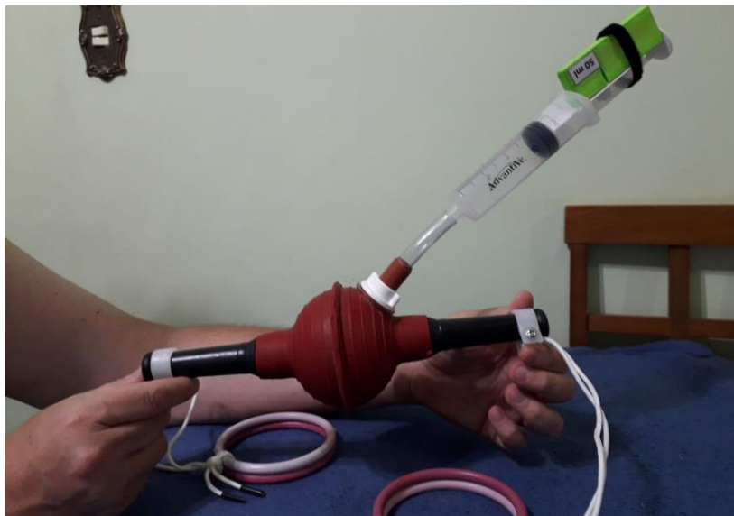
Figura 8: Montagem Experimental Obtida dos Passos Anteriores para o Experimento B.

Para esse experimento, utiliza-se a seguinte configuração, com a seringa sendo utilizada como uma bomba de vácuo manual, que é obtida realizando-se os passos anteriores de i a v: