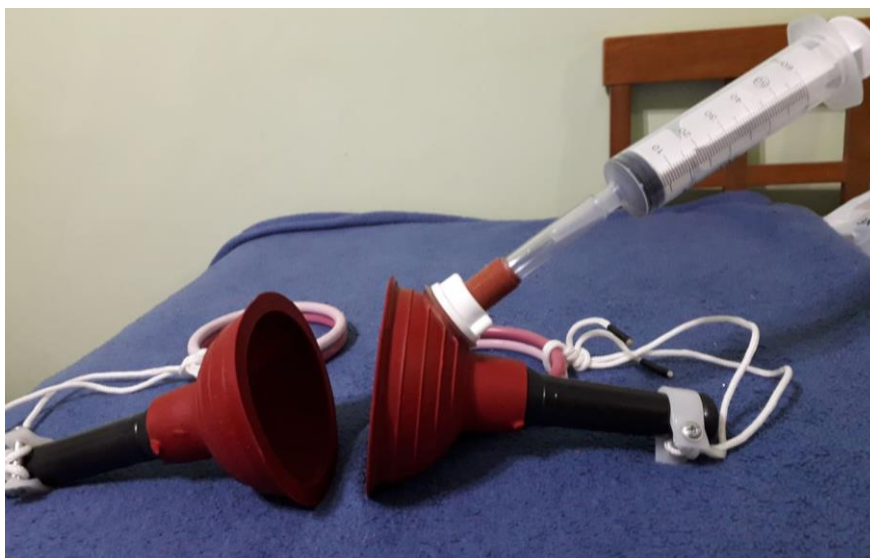
Figura 9: Montagem Experimental para o Experimento B.

Para tanto, utilizam-se dois desentupidores de pia, sendo que em um deles foi adaptada uma seringa de injeção sem agulha, conforme mostra a figura a seguir: