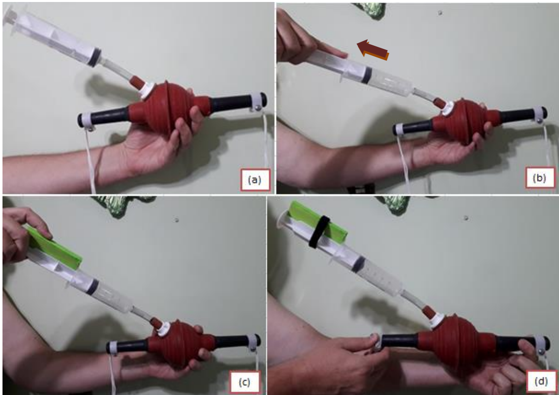
Figura 7: (a), (b), (c) e (d) Acionamento da seringa para retirada ar, passo a passo.